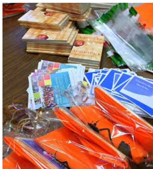
聖誕節前夕華人佈道會向找到新居的災民派發歡迎包，包裹有布袋、福音書和華人佈道會的資料。願主叫這些福音種子多結果子。