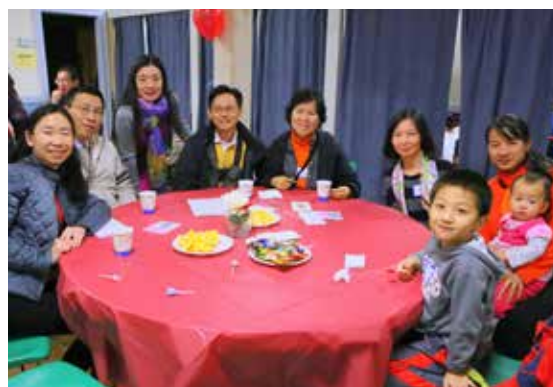
牛頓國語堂：感恩節聚餐及晚會（11/25）