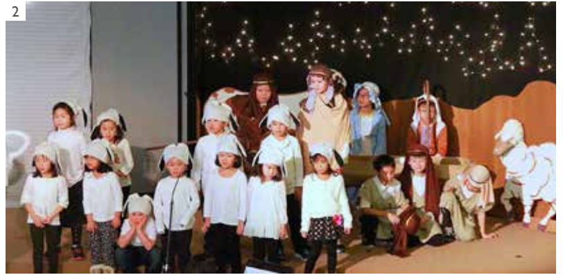
英文兒童聖誕聯歡會：1) 華埠堂 (12/20) 2) 牛頓堂 (12/12)