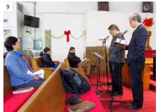
7-9) 新年祈禱會 (1/1)