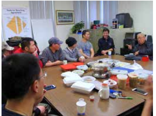
華埠國語堂：各團契的感恩節及聖誕聚會