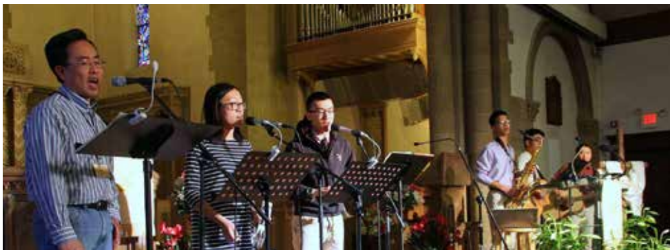
牛頓英文堂：復活節主日清晨，會眾一起敬拜和食早餐慶祝復活節 (3/27)