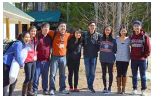
英文大學團契退修會 (3/11 - 3/13)