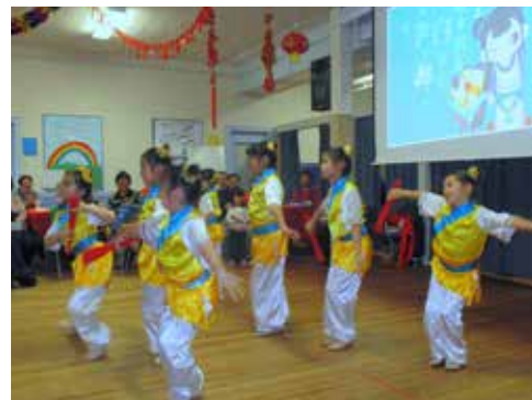
牛頓國語堂：農曆新年慶祝晚會 (2/6)