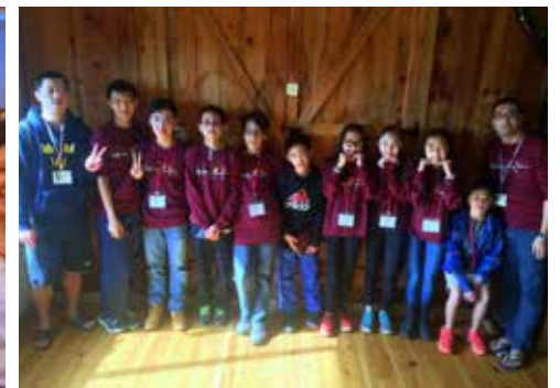
英文青少年冬令會：初中生 (2/26-2/28) 和高中生 (2/12-2/15)