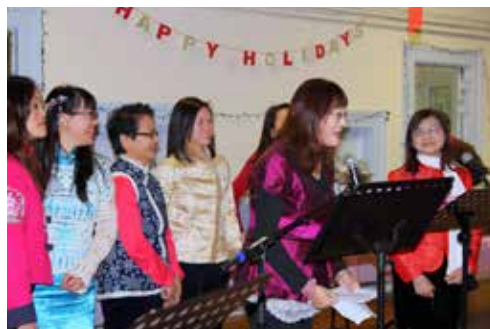
牛頓粵語堂新年聯歡 (2/13)