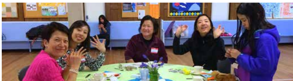
牛頓英文堂婦女茶敘 (4/30) —— 主題為「君王的公主」，姊妹一起分享團契，還有嘗試美甲彩繪藝術。